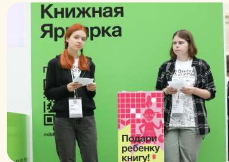
ММКЯ — 2022