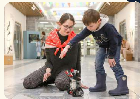
ПРОСТО КОСМОС — 2022