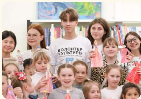
БИБЛИОНОЧЬ — 2022