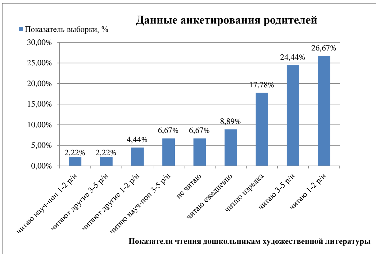
Рис. 1. Показатели чтения родителей дошкольникам художественной литературы

Выявленные анкетированием различные подходы респондентов-родителей к чтению детям были оценены с точки зрения влияния на качество родительского чтения различных факторов: принимались во внимание регулярность, частота, содержание чтения, а также читает ли родитель ребенку сам или оставляет эту роль другим. В этой связи были рассмотрены несколько вариантов оценки качества чтения, для каждого из которых по статистическому критерию хи-квадрат Пирсона была вычислена значимость взаимосвязи данных анкетирования родителей и данных диагностики эмоционального состояния дошкольников. В результате был выделен вариант, продемонстрировавший наиболее значимую взаимосвязь, и, следовательно, описывающий наиболее эффективный подход родителя к чтению ребенку, с точки зрения профилактики тревожности и других эмоциональных нарушений у детей дошкольного возраста (см. табл. 1).